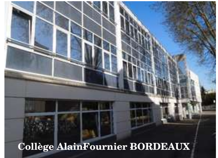
Collège Alain Fournier BORDEAUX